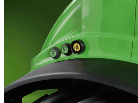
Die Bedienung von Heckkraftheber und Zapfwelle erfolgt über Taster in den Heckkotflügeln.