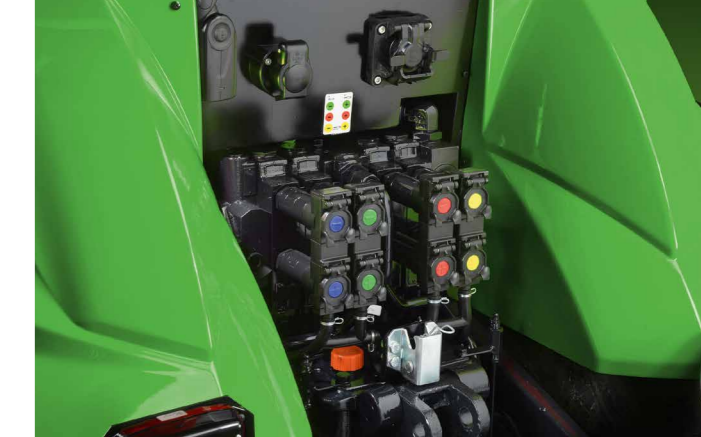
Vier elektrohydraulisch betriebene doppelt wirkende Steuerventile für eine einfache und traktoreigene Bedienung von Anbaugeräten.