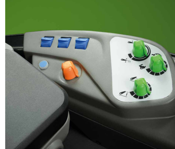
Farblich eindeutig differenzierte Drehpotentiometer und Drehschalter für eine intuitive Handhabung und Bedienung.