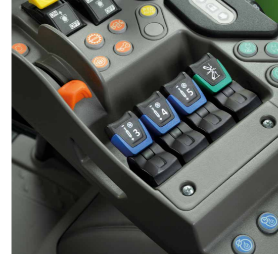
Präzise Bedienung der Zusatzsteuerventile und des Heckkrafthebers griffgünstig mit Fingertippschaltern in der MaxCom Armlehne.