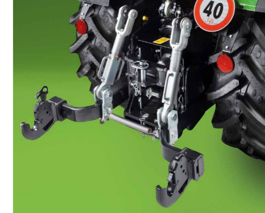
Elektronisch gesteuerter Heckkraftheber mit einer maximalen Hubkraft von 2600 kg.