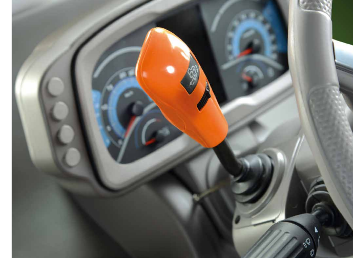
Der Fahrtrichtungswechsel erfolgt über den individuell einstellbaren Powershuttle-Hebel links vom Lenkrad.